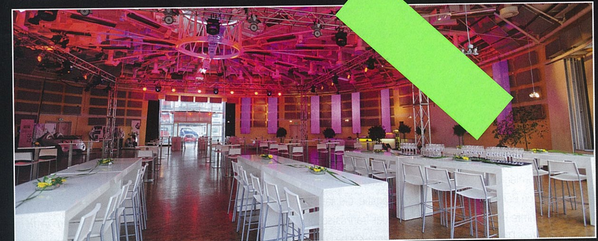
Impressionen der PURA GmbH Saarlouis – Agentur für besondere Ereignisse Impressions de l'agence événementielle PURA à Sarrelouis

Genuss mit Garnelen Crevettes – un régal ..... 44 a